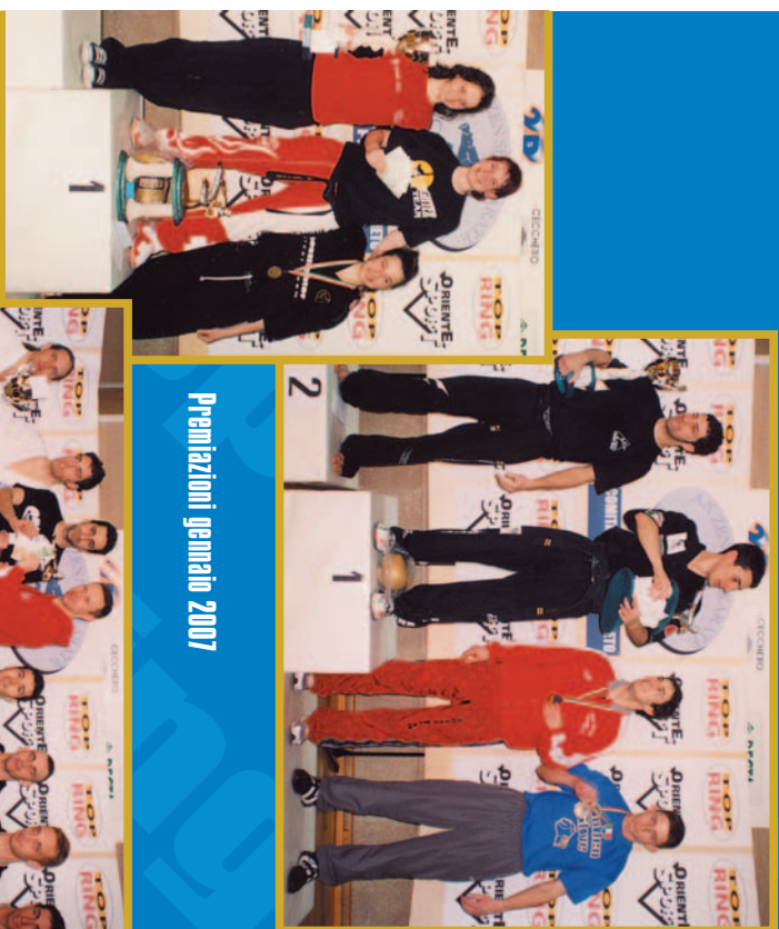
Premiazioni gennaio 2007