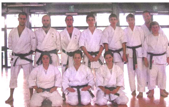
Foto: le cinture nere della Dan bayashi