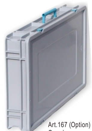
Art.167 (Option) Carrying case