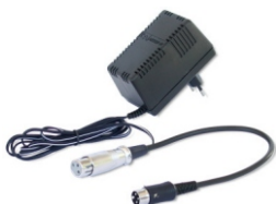
Art. 829 (Option) Battery charger