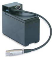
Art. 828 (Option) Battery